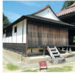
▲小斎 藩主が臨学の際に使用する、御成の間。