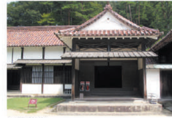
▲習茅斎 農民たちが学んだ、教室として使われた施設。