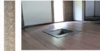
▲教室 教師と生徒たちが、湯茶を啜した休憩室。

「斯爐中炭火之外不許薪火」 中央の炉のふちに彫り込まれている文字。火の使用に厳重な注意がはられていました。